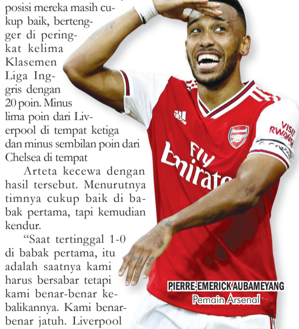
PIERRE-EMERICK AUBAMEYANG Pemain Arsenal