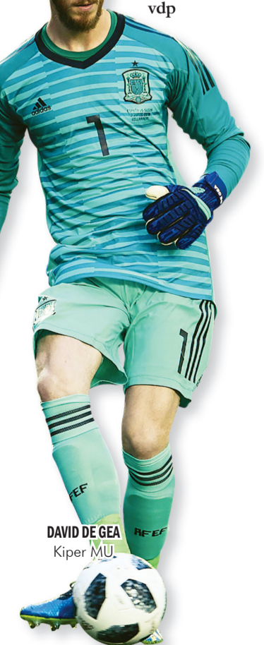
DAVID DE GEA Kiper MU

Sebagaimana diketahui Solskjaer meninggalkan Old Trafford setelah tiga musim dan tanpa memenangi trofi. Namun, Solskjaer berjasa dalam mengembalikan Setan Merah ke papan atas dalam dua musim terakhir.