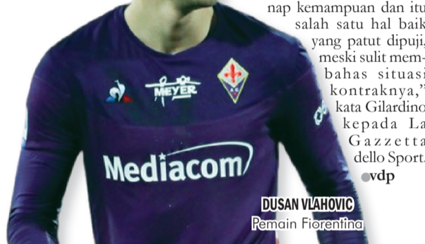
DUSAN VLAHOVIC Pemain Fiorentina

Korban terbaru pemuda 21 tahun kelahiran Belgrade, Serbia itu adalah AC Milan. Dua gol cantik ia ciptakan ke gawang Ciprian Tatarusanu, membantu Fiorentina menang 4-3, membuat Milan merasakan kekalahan pertama Serie A musim ini. Saat itu kualitas Vlahovic sebagai bomber nomor 9 yang mengerikan pun terlihat. Pada gol pertamanya, ia menunjukkan kualitasnya dalam membaca situasi, kemudian memosisikan diri dengan baik saat menerima umpan serangan balik.