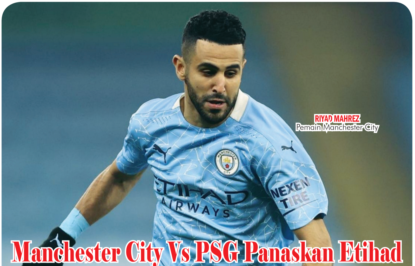
RIYAD MAHREZ Pemain Manchester City